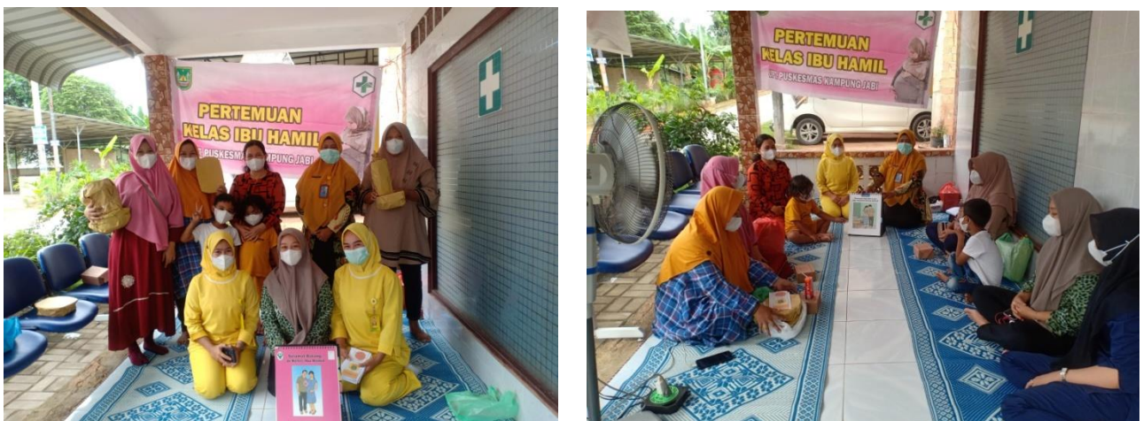
Gambar 1. Dokumentasi Penyuluhan

Adapun dokumentasi pada saat kegiatan penyuluhan sebagai berikut :