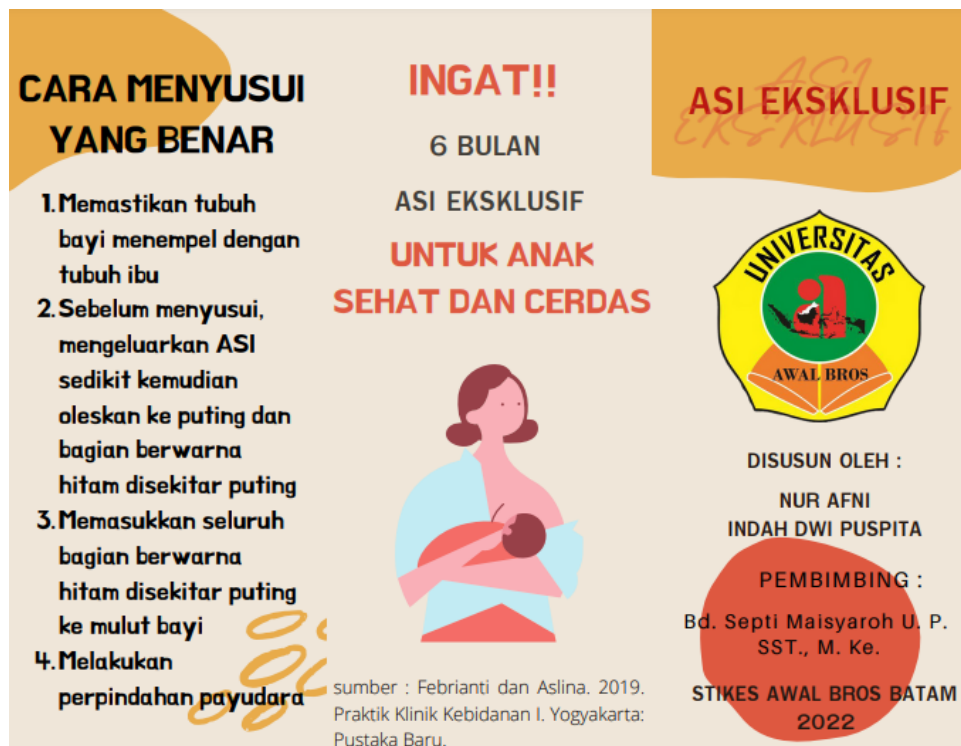
Gambar 3. Leaflet Materi Penyuluhan